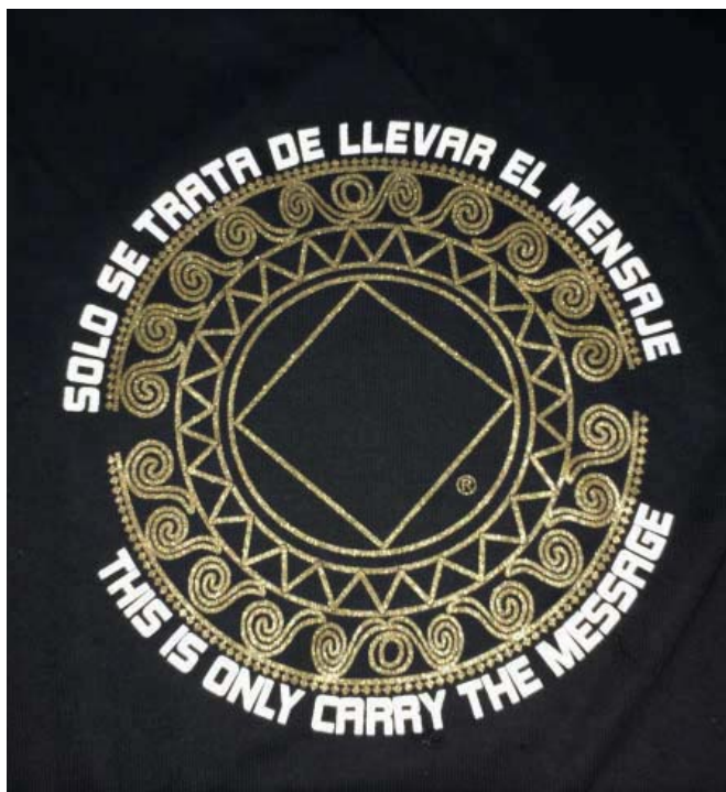
H&I, Peru (Se trata apenas de levar a mensagem)

para o Reaching Out; A/C NA World Services; PO BOX 9999; Van Nuys, CA 91409 (inglês) ou, se preferir, para o Centro de Serviços HOW Brasil (A/C: Reaching Out) – Rua Ferreira Penteadó, 1331 – Fundos – Bairro Cambuí – CEP 13010-041 Campinas – SP (Português).