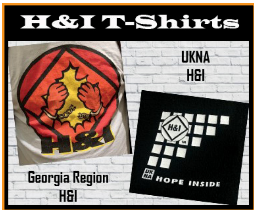
Camisetas de H&I Região Geórgia e Região Reino Unido.

NOTA: Somente as cartas, artes e/ou fotos enviadas aos cuidados do Reaching Out serão enviadas aos editores para publicação e, o envio destas para um dos endereços acima, implica a autorização do autor para sua publicação.