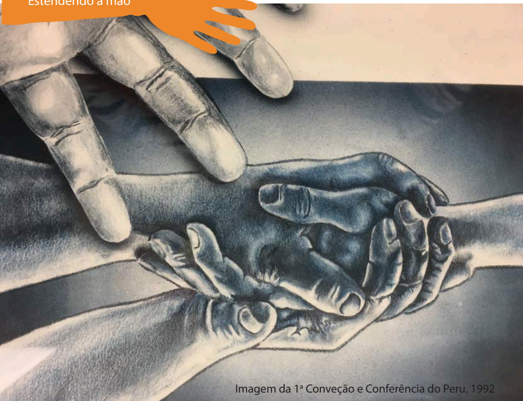
Imagem da 1ª Conveção e Conferência do Peru, 1992