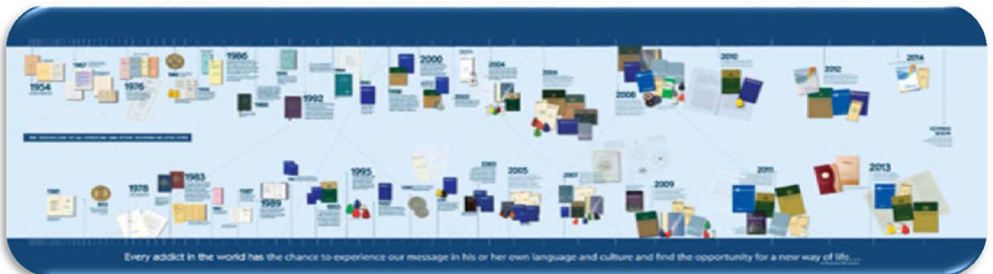
NA Literature Timeline

rétablissement. Toute tentative par des individus ou des groupes d'imprimer des textes NA modifiés n'est pas conforme à la conscience de groupe de la Fraternité de NA. Les groupes de NA, en tant que détenteurs de la propriété intellectuelle de NA et les Services Mondiaux de NA en tant que mandataires gérant cette propriété intellectuelle sont partenaires dans les actions de protection du copyright de NA. Nous vous demandons de vous inscrire dans ce partenariat et de vous rappeler que les groupes de NA ont le droit et le devoir de demander à ceux qui souhaiteraient réimprimer ou modifier nos textes de NA de ne pas le faire. Le rétablissement personnel dépend de l'unité de NA ; nous devons œuvrer ensemble à la préservation de l'intégrité de ces textes qui sauvent des vies.