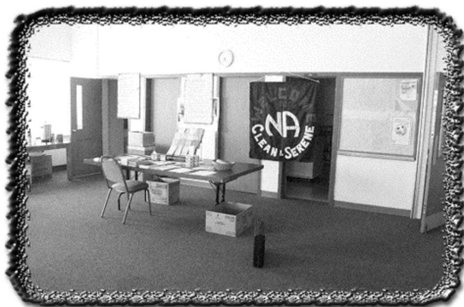
Grupo Limpo e Sereno, Colorado/EUA