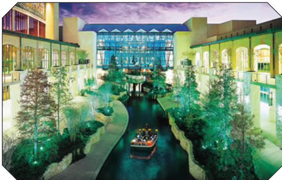
Henry B Gonzales Convention Center San Antonio Riverwalk, CMNA-32

La 32e Convention mondiale de NA (CMNA) « Our Message Hope, Our Promise Freedom » (notre message, l'espoir ; notre promesse, la liberté) se tiendra à San Antonio au Texas ! Etes-vous inscrits ? Avez-vous réservé votre billet ? Avez-vous consulté www.na.org/wcna32/index.htm pour connaître le programme CMNA-32 ? Vous ne voulez pas vraiment manquer cette convention mondiale. Certainement pas ! Alors que les Services mondiaux de NA se dirigent vers un mode de fonctionnement de « convention mondiale », le comité de programme a fourni ses recommandations pour les intervenants principaux et il commence à examiner les orateurs des ateliers sur la base de la liste des préinscriptions. Nous commençons également à examiner les sujets des ateliers, nous terminons le programme récréatif (avec le concert du samedi) et nous aurons les produits dérivés les plus chouettes que nous ayons jamais proposés !